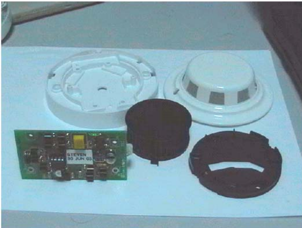
Partes constitutivas del detector de humo.