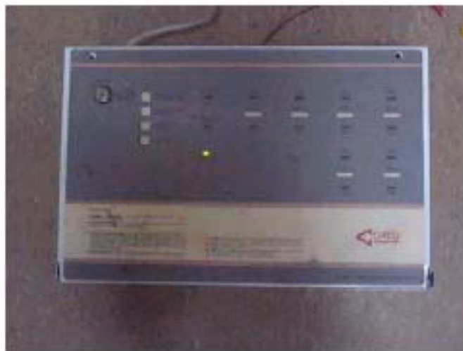
Fotografía 1 – Panel de Incendios clásico utilizado para las pruebas.

Como se puede observar en la figura 1, El panel general de incendio provee la alimentación de + 24VDC a todos los detectores de humo conectados en paralelo unos con otros. Un panel típico se muestra en la fotografía 1 y este será utilizado para probar funcionalmente a nuestro detector de humo.