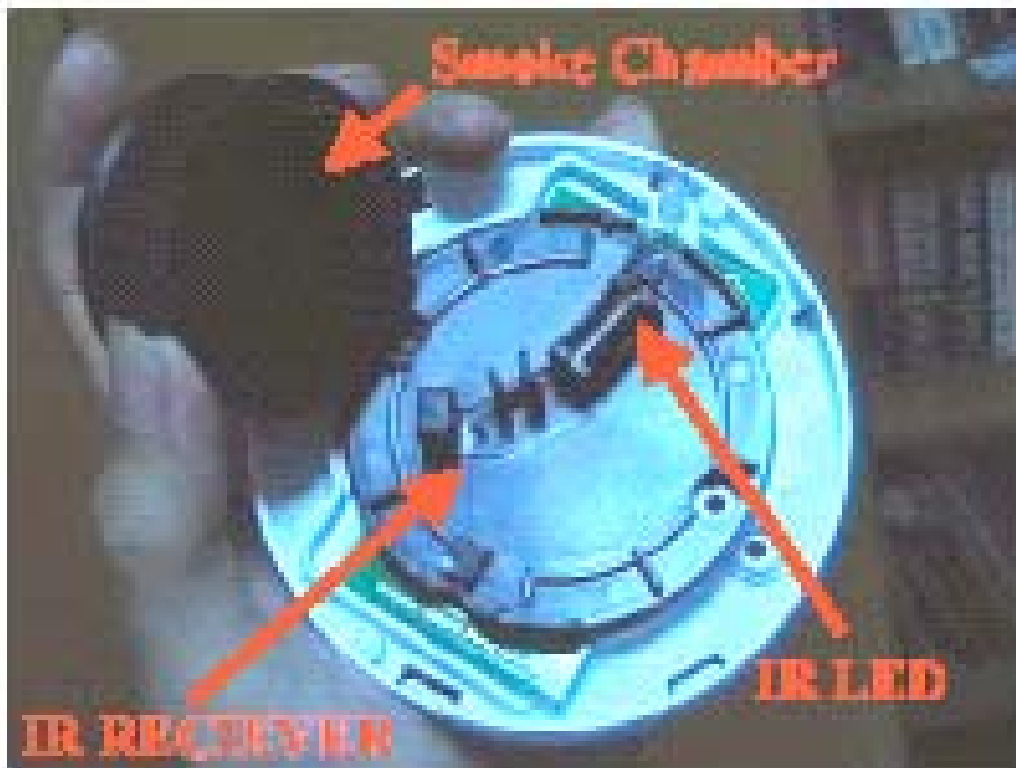
Fotografía 2 – Detalle ampliado de la cámara de humo y las ubicaciones del diodo emisor y diodo receptor infrarrojo.

La fotografía 2 muestra el montaje de la cámara de Humo.